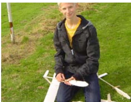
Valt er hier nog wat te repareren?