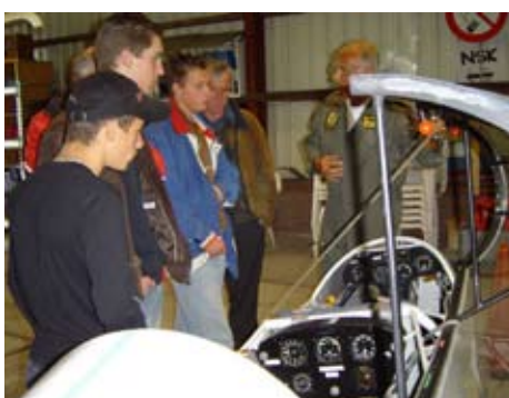
Excursie De Peel