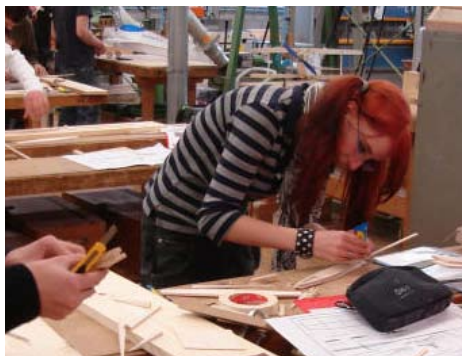
Zelfs een dame in de ploeg

In de vorige uitgave van "Modelvliegsport" hebben we kunnen lezen over het succes van het Fantraproject zoals dat op diverse VMBO scholen in de regio Midden Brabant werd uitgevoerd.