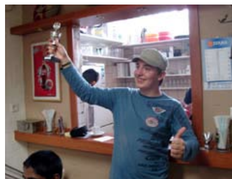
En ik heb het langs gevlogen