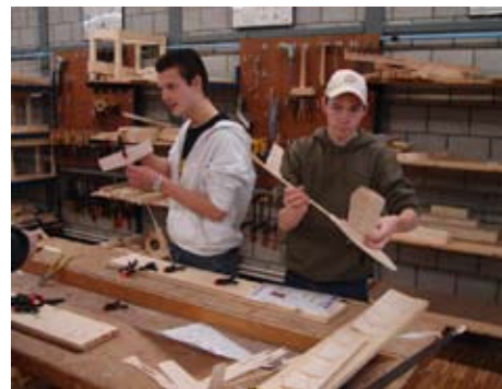
Maar het resultaat mag er zijn

Uiteraard moest er ook gevlogen worden met de modellen. Dat gebeurde op een aantal vliegdagen op het terrein van de Luchtvaart-