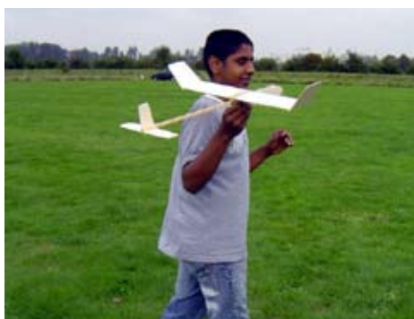
Klaar voor de start