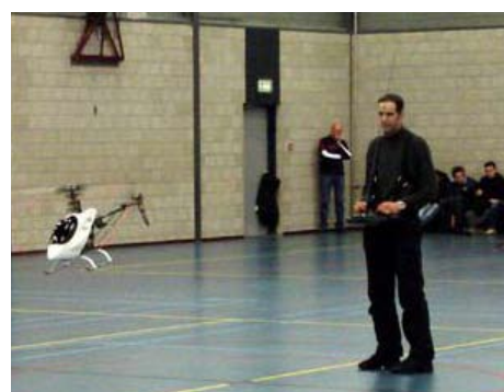
Demo indoor Sporthal GHC